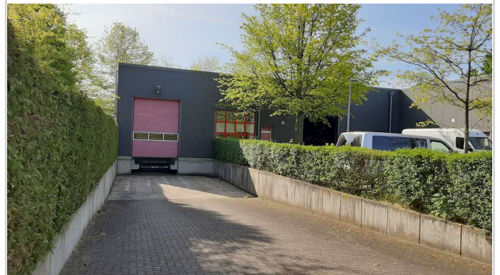
Halle 1 Im Finigen 5