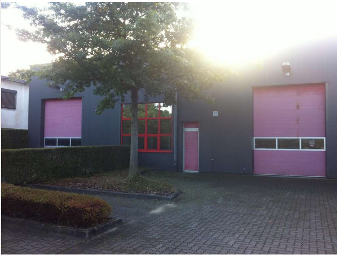
Halle 1 Im Finigen 5

Miet- / Kaufobjekt: Miete Lager- /Produktionsfläche: 1.060,00 m 2 Gesamtfläche: 0,00 m 2 Miete pro m 2 : 3,90 EUR