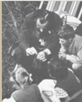
Mit Theodor Lessing auf Naturentdeckung, 1930