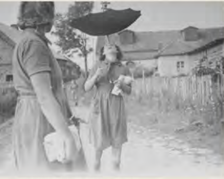
Beim Reichsarbeitsdienst in Ostpreußen, 1940

Wenn ich es nicht werden will und dafür Schiethustapeziererin bevorzuge, so werde ich es auch. Ich will mich erst einmal hier in Berlin umsehen, und alles Weitere wird sich dann schon finden.“ Als freiheitsliebende, dem Leben zugewandte Menschen teilten die beiden Schwestern miteinander die tief empfundene Ablehnung des Nationalsozialismus. Gemeinsam organisierten sie ab 1940 in Berlin Hilfe für französische Kriegsgefangene, ukrainische Zwangsarbeiterinnen und verfolgte Juden.