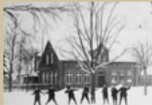
Die alte Schule 1930, heute Kita