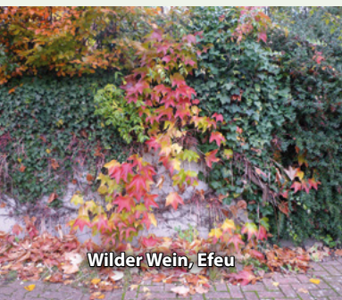
Wilder Wein, Efeu